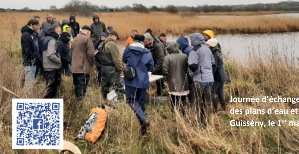
Journée d'échange thématique sur la gestion des plans d'eau et leur environnement, à Guissény, le 1 er mars.