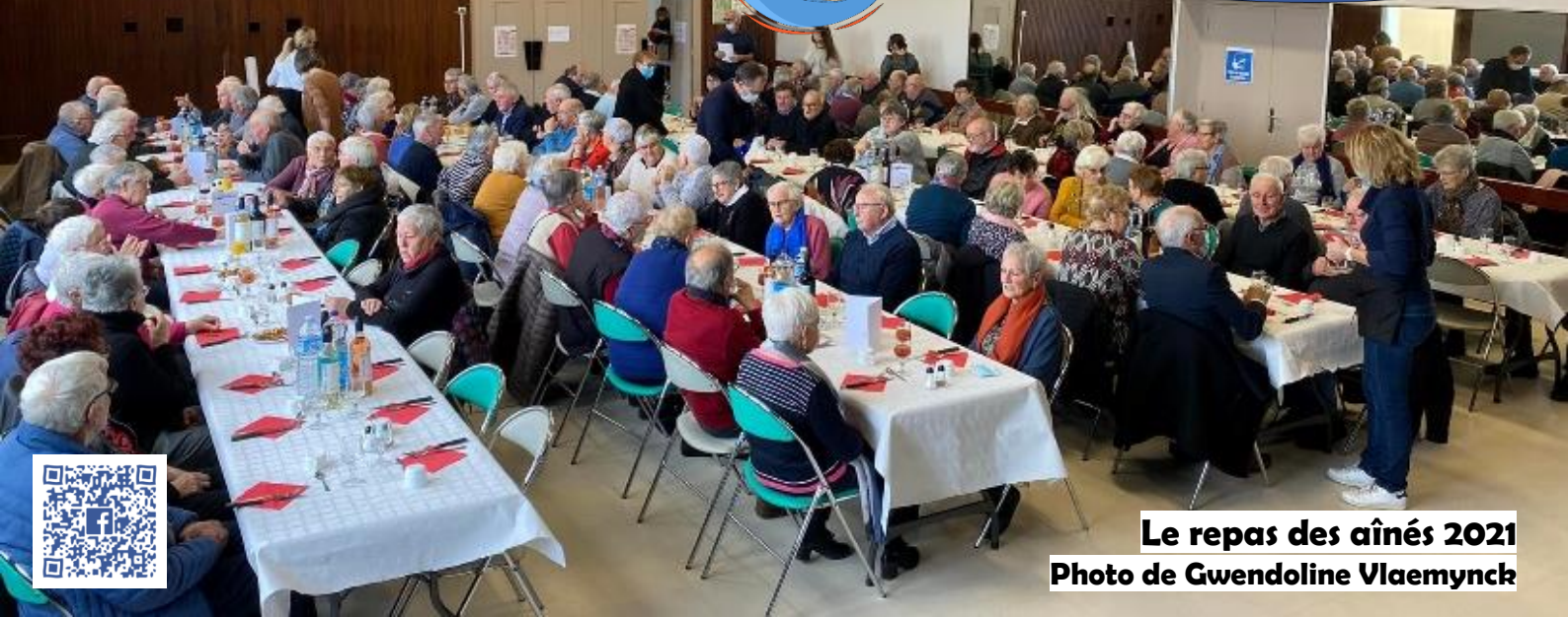
Le repas des aînés 2021